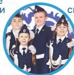
Юные инспектора дорожного движения